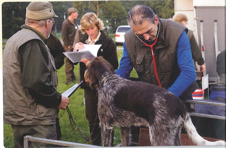
Het was even flink doorwerken voor de dierenarts van Dierenartspraktijk Vaassen, die in een half uur 66 honden kreeg te keuren, maar alles was OK.

Omdat de organisatie vorig jaar een perfect draaiboekje bleek te hanteren, iedereen er nu ook weer bij aanwezig was en alles snel verliep, had de organisatie voor dit jaar de limiet van 60 deelnemers opgehoogd naar 70. In de praktijk bleek ook dit aantal honden prima te hanteren, ook al kwamen op de dag van de proef nog twee afzeggingen binnen en waren de reserves al opgesoupeerd in de aanloop naar de proef. Men had er alles aan gedaan om ervoor te zorgen dat de doorstroming bij het apport over water geen enkel oponthoud zou krijgen en daar een extra helper ingezet voor de logistiek. Ook de volgorde van de proeven werd zodanig vormgegeven, dat de deelnemers geen onnodige meters te lopen kregen. Dit ondanks het feit, dat afgelopen jaar het terrein meer geschikt werd gemaakt voor recreatie op de Veluwe door het bouwen van een waterskibaan en extra horeca daar omheen. Daarmee konden de C- en B proeven weer keurig tegen 13 uur worden afgesloten, waarna bleek dat liefst 16 van de 18 aangemelde honden zich voor de A-proeven hadden gekwalificeerd. De 6 diskwalificaties van de dag ( 2 bij het markeren en 4 bij