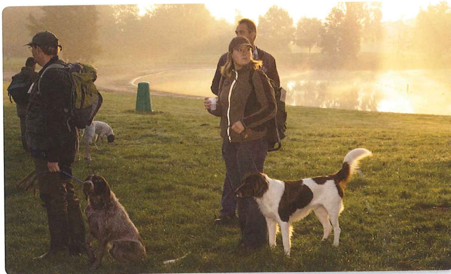
Optrekkende nevel als de eerste deelnemers arriveren.

66 honden haalden uiteindelijk 48 honden een diploma. Het was alleen jammer dat het terrein van de dirigeerproef toch wat tijdelijke bewoners (hazen) had, die sommige honden hinderden in hun werk. Mede daardoor kwamen van de 16 deelnemende honden slechts 2 door de dirigeerproef. De daaropvolgende sleep bleek voor beide geen probleem, hoewel een van de honden ook hier eerst een dwaalspoor kwam, maar uiteindelijk gelukkig het juiste sleepspoor vond. De winnaar verzamelde liefst 93 punten, een score die al enige jaren niet